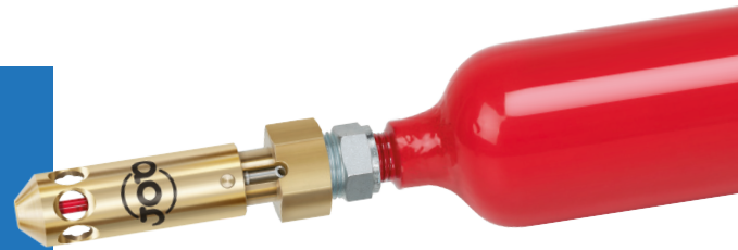
AMFE - thermische Auslösung

Es gibt verschiedene Ausführungen der AMFE. Sie unterscheiden sich durch die Auslöseart.