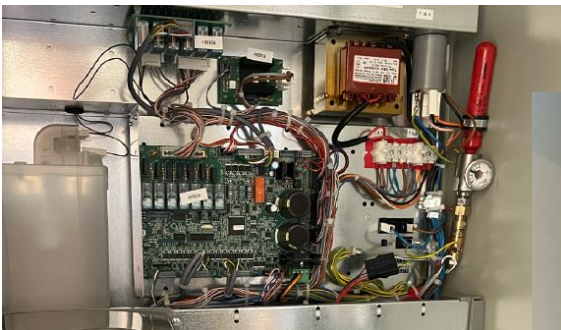
Die verbaute S-AMFE im Snackautomat

Sollte es zu einem technischen Defekt und Brand im Inneren der Snackautomaten kommen, wird neben der direkten automatischen Löschung vor Ort durch eine Aufschaltung auf die Brandmeldezentrale das Ereignis sofort an die Haustechnik bzw. Feuerwehr gemeldet.